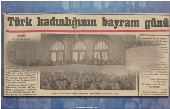
Şekil 5. Kadınlar Meclis Locasında