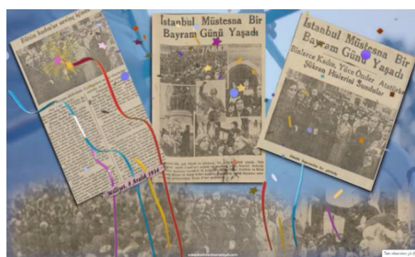
Şekil 7. 1934 Mitingi Gazete Haberleri