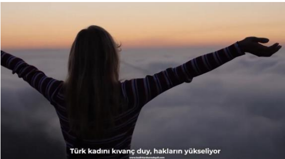
Şekil 10. Hakları yükselen Türk Kadını (Temsili)