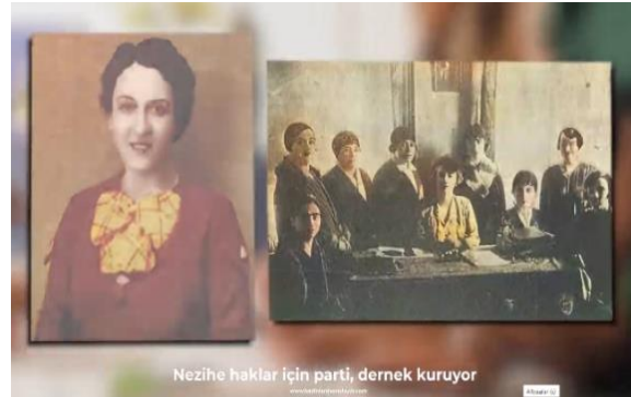
Şekil 10. Nezihe Muhiddin ve Kadınlar Birliği Üyeleri