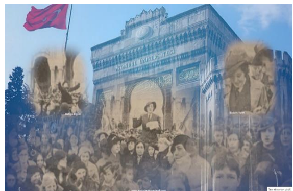
Şekil 6. 1934 Beyazıt Mitinginden Kolaj Sahne