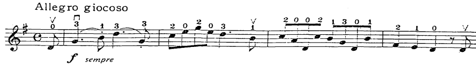
Tablo 16: The Happy Farmer (R. Schumann), Hedefler ve Bu Hedeflere Uygun Davranışlar